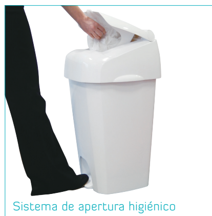
Sistema de apertura higiénico